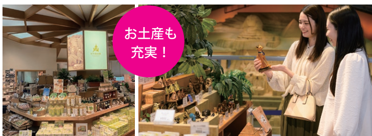
SUNABI SHOP [鳥取の特産品]