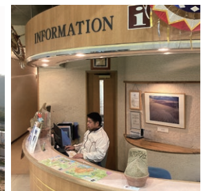
観光案内所を併設