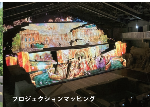
プロジェクションマッピング