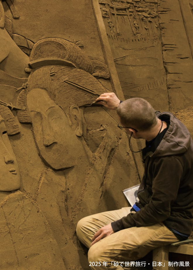
2025年「砂で世界旅行・日本」制作風景