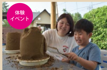
ミニ砂像体験など楽しいイベントも開催！