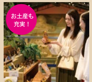
ミュージアムショップ